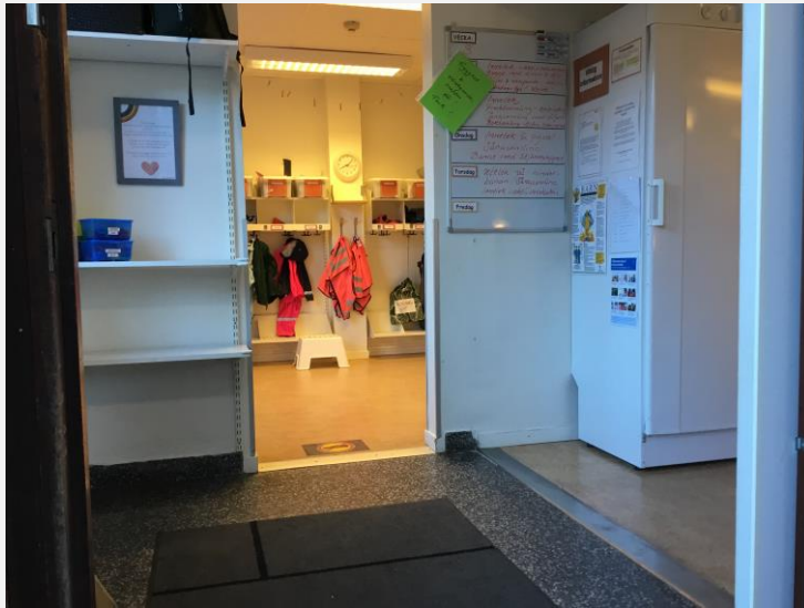
STJÄRNGRUPPEN 1-2 ÅR